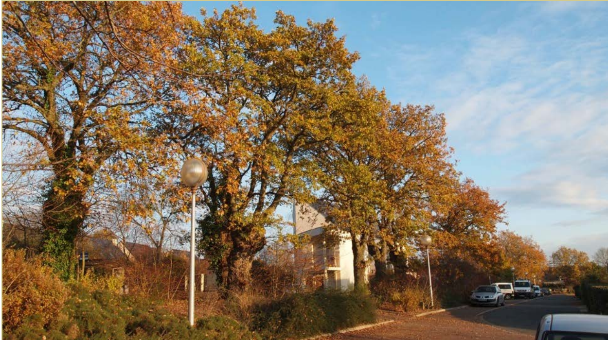
Vieilles trognes en milieu urbain, ville d'Angers. Un patrimoine en voie de disparition préservé.